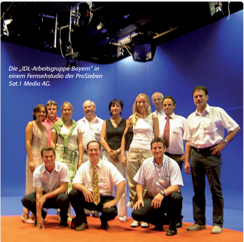
Die „IDL-Arbeitsgruppe Bayern“ in einem Fernsehstudio der ProSieben Sat.1 Media AG.