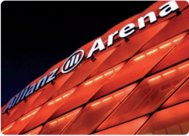
Bevorzugte Tagungsstätte von IDL: die Allianz Arena in München