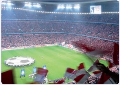
Stadionperspektive FC Bayern München - Real Madrid während eines IDL-Tagungsevents